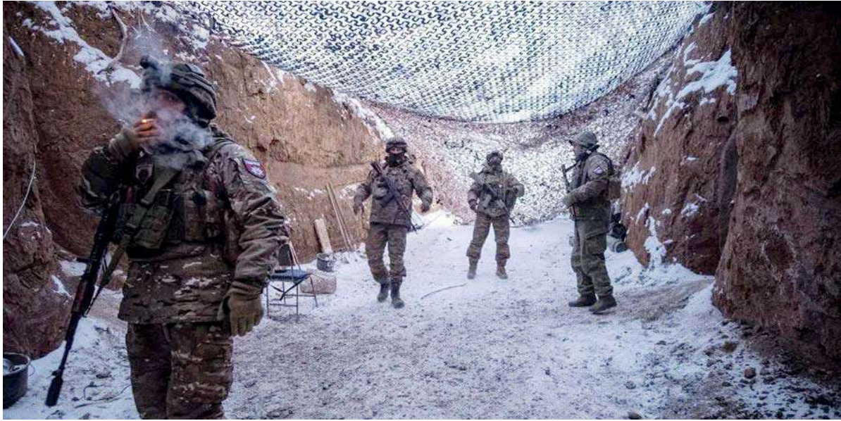
Territorio en conflicto. Soldados ucranianos en el frente del Donbás.

Un funcionario de la Casa Blanca declaró a NBC News: "La reunión trilateral en Abu Dabi entre Estados Unidos, Ucrania y Rusia fue productiva. Las conversaciones continuarán mañana".