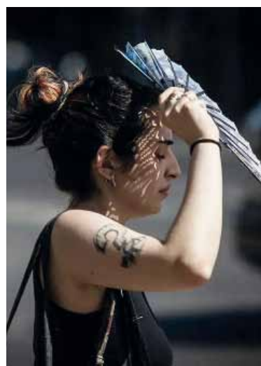
En alerta. Por las altas temperaturas en territorio bonaerense.

cuando las marcas máximas y mínimas igualan o superan durante al menos tres días consecutivos y en forma simultánea, ciertos valores umbrales que dependen de cada localidad. Y eso es lo que seguramente pasará en gran parte del territorio bonaerense. -DIB-