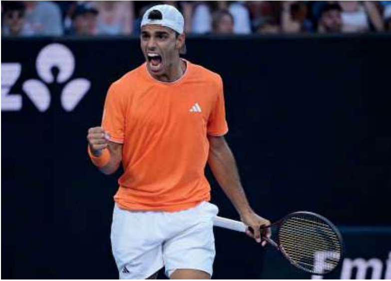
¡Gritalo! “Rulo” se metió por primera vez entre los 16 mejores del torneo.

El segundo capítulo elevó la tensión. Rublev intentó asumir el control, presionó desde la devolución y dispuso de chances para quebrar, pero Cerúndolo respondió con temple y paciencia. El set desembocó en un tiebreak cargado de nervios, donde el porteño mostró mayor claridad, administró mejor los riesgos y se quedó con un parcial decisivo que lo dejó 2-0