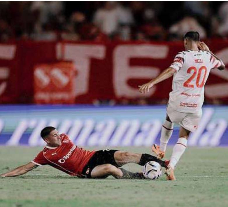
Pierna fuerte. Partido intenso y cargado de tensión en Avellaneda.