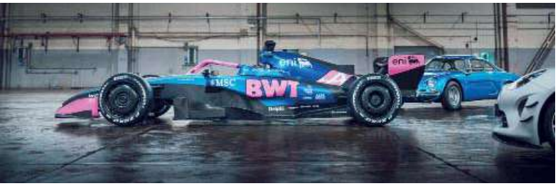
Glamour. El A526 fue exhibido en un cruceo en Barcelona.

La escudería francesa reveló su nuevo diseño y ya palpita la nueva era de la Fórmula 1.