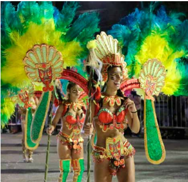
Imagen de los carnavales en 2023.

Asimismo, según le dijeron a este medio fuentes vinculadas al municipio, el lugar elegido para llevarlo