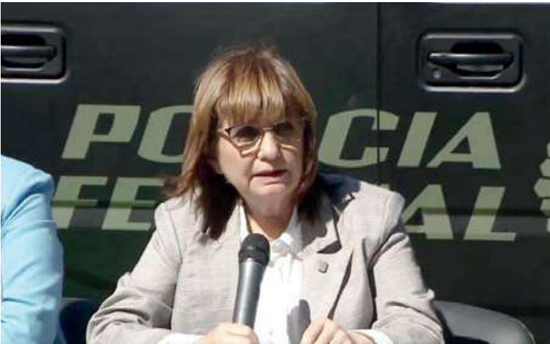
Insiste. Patricia Bullrich vuelve a impulsar la reforma penal.

“Este año los espero a todos para tratar la Ley Penal Juvenil en el Congreso”, dijo la senadora en una publicación en la red social X.