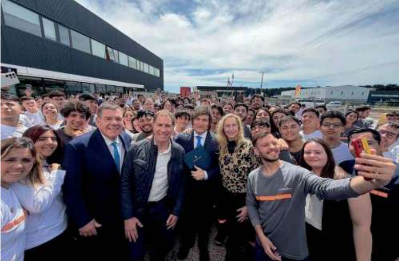
Regresa. El presidente Javier Milei en una de sus últimas visitas a Mar