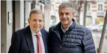
Encuentro. Jorge Macri junto a González Urrutia